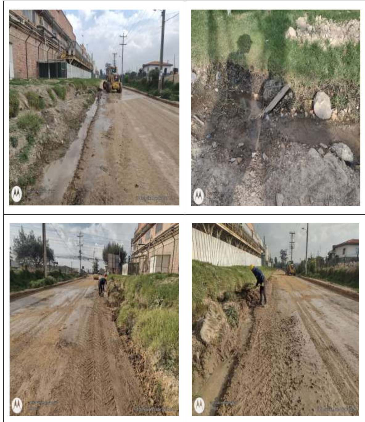
TABLA 1. REGISTRO FOTOGRÁFICO DE OBRA VERTIMIENTOS A LA VÍA POR LA EMPRESA AJE COLOMBIA SAS – BIG COLA

A continuación, se presenta un registro fotográfico histórico donde se evidencia estos vertimientos o descargues de aguas hacia la vía y por ende por pendiente van dirigidas hacia el Humedal Gualí; se presenta registro desde inicio de la obra hasta el presente periodo: