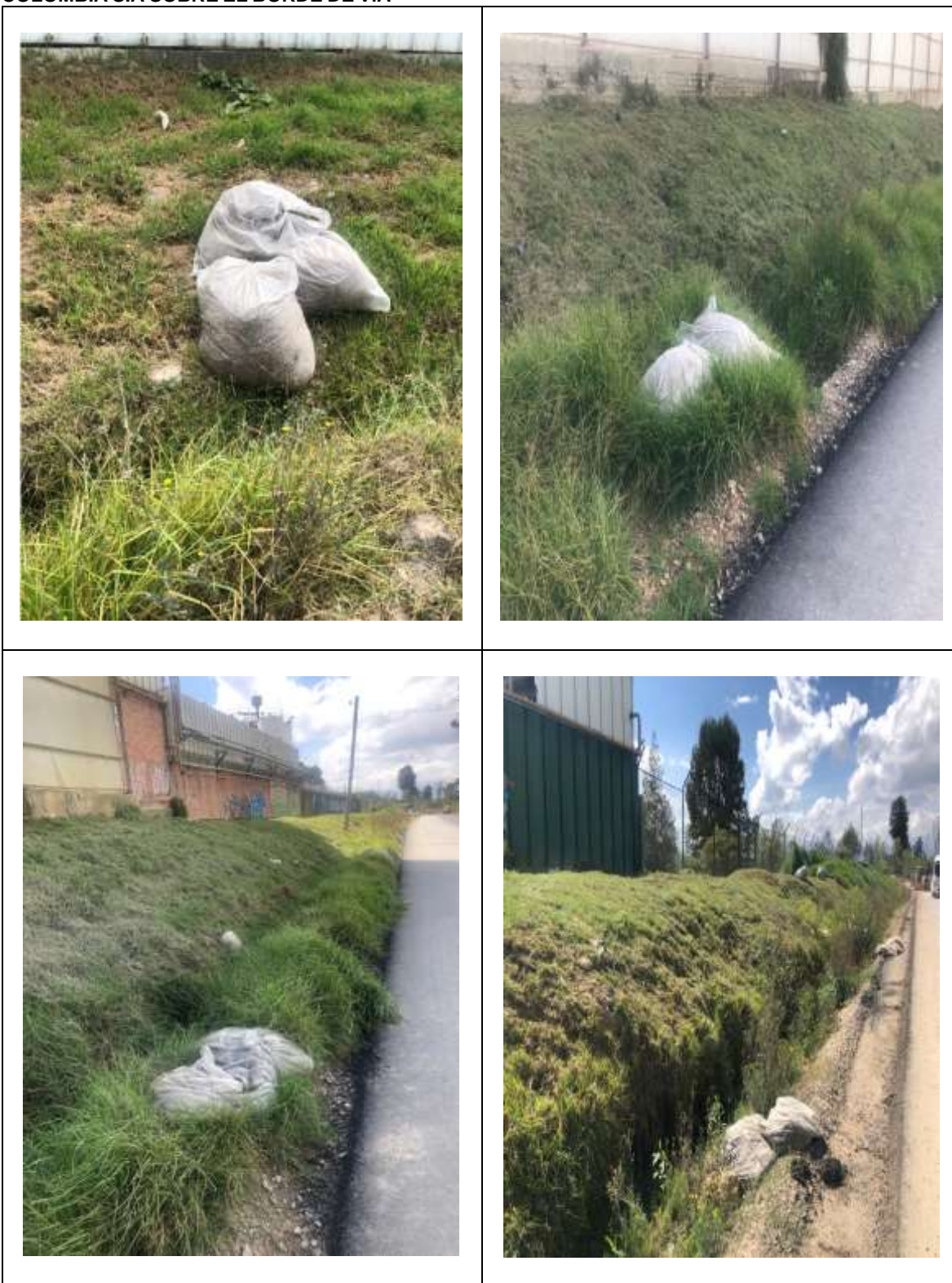
TABLA 2. BOLSAS CON DESPERDIOS DE PODA – MATERIAL VEGETAL DISPUESTOS POR AJE COLOMBIA S.A SOBRE EL BORDE DE VÍA